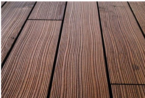
Thermo- Esche Strukturprofil

Durch innovative Oberflächentechnik ist es gelungen, angenehme Verwitterungseffekte vorwegzunehmen. Das Holz erhält eine tiefe, unregelmäßige Struktur von lange gealtertem Holz- ohne dass sich die unangenehmen Effekte des natürlichen Alterungsprozesses wie Spannungsrisse und Jahrringablösungen unangenehm bemerkbar machen. In Optik und Haptik ein Fest für die Sinne! Gepaart mit den hervorragenden Eigenschaften der Thermo- Esche und wegweisender Systemverpackung auch preislich sehr attraktiv!